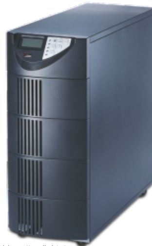
MARS | | serijos šaltinis

** lentelėje pateikti duomenys tik apie populiariausius išorinių baterijų bankus. Be šių baterijų bankų, galimi ir kiti variantai su papildomais vidiniais įkrovikliais ar be jų, bei įvairaus dydžio ir talpos baterijomis.