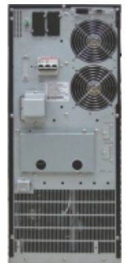
Vienos fazės MS | | serijos nepertraukiamo maitinimo šaltinio galinė dalis